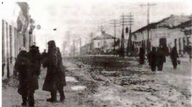
На адной з вуліц Слуцка. 1943 г.

Харчовае забеспячэнне насельніцтва праводзілася па картках. Рабочы прадпрыемства атрымываў па 300 г