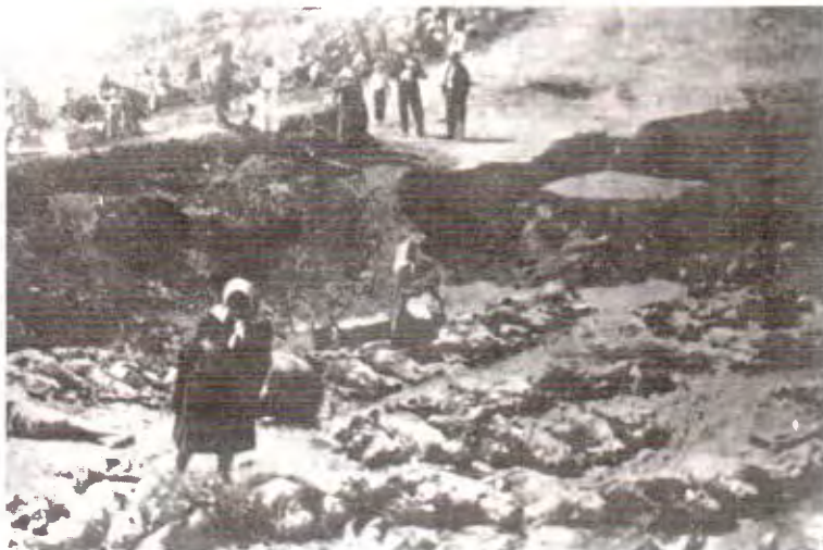
Места массовых расстрелов взятых Слущкага лагера воен- напагонных.