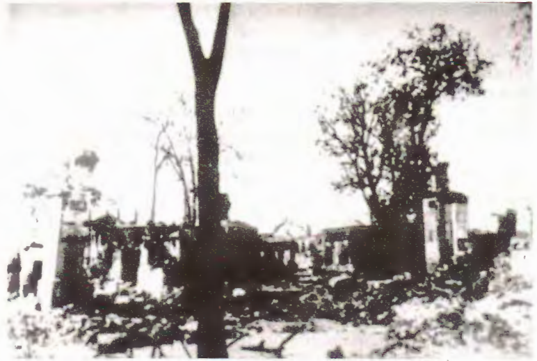
Будынкі ў Слуцку, разбураныя нямецка-фашысцкімі захопнікамі ў чэрвені 1941 г.