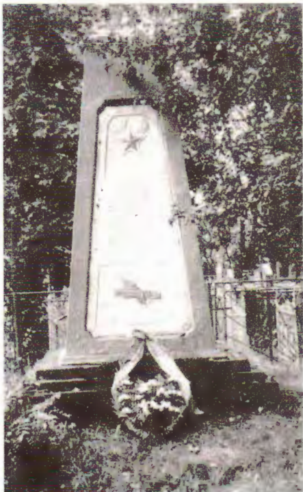
Помнік загінуўшым ваеннапалонным на гарадскіх могілках.

Для установлення численности захароненных нами вскрыты в нескольких местах обе ямы-могилы, в которых по всей площади обнаружены человеческие скелеты в несколько рядов. Врачебно-медицинской экспертизой установлено: трупы захоронены в 1941—1943 гг.