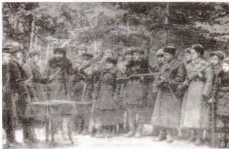
Партизаны бригады имя Суворова прымаюць прысягу. 1942 г.