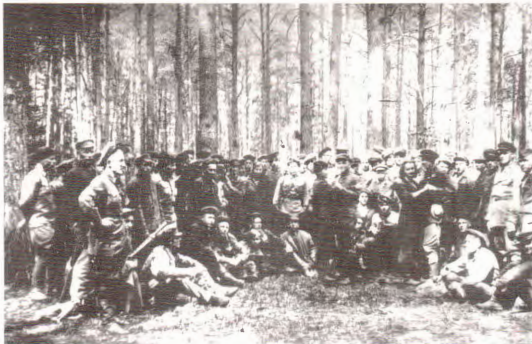
Партизаны бригады им. Чкалова ў час адпачынку.

Образован в сентябре 1941 г. в Любанском районе из группы военнослужащих, местных коммунистов и комсомольцев. В декабре 1941 г. к нему присоединилась