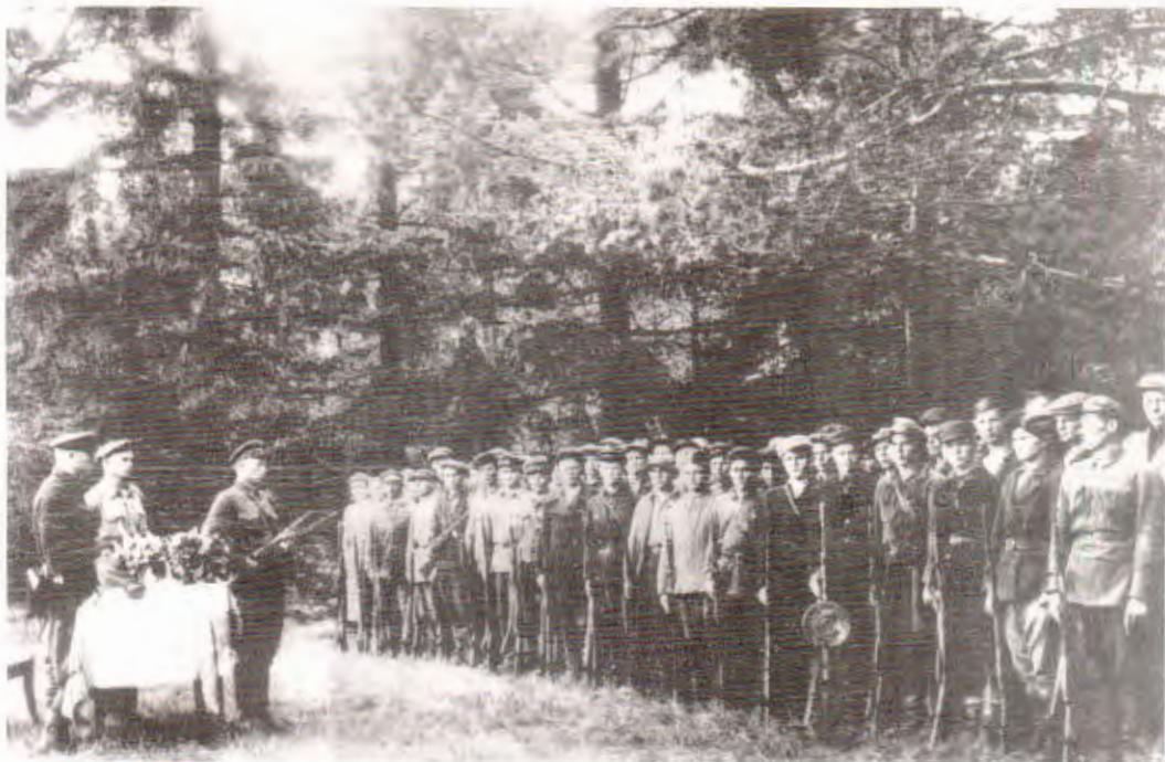
Уручэнне ўзнагарод партызанам атрада імя Катоўскага брыгады імя Чкалава. 1943 г.

Сформирован в мае 1943 г. из жителей д. Переспа Любанского района и инициативной группы, выделенной бригадой в марте 1943 г.