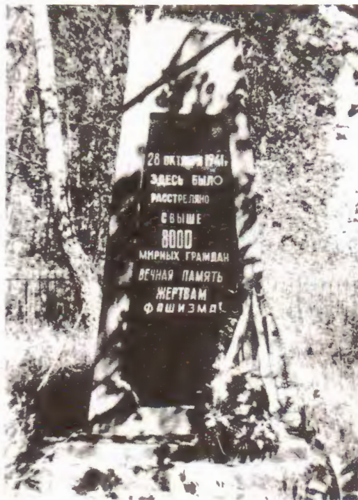
Помнік на магіле ахвяр фашызму ва ўрочышчы Гараваху.

Але самы вялікі расстрэл яўрэяў пачаўся ў лютым 1943 г. На гэты раз было знішчана гета, якое размяшчалася ў раёне цяперашняй сярэдняй школы № 6 аж да фабрыкі хімчысткі. Тут знаходзілася звыш 3 тысяч чалавек. Яўрэям, якія маглі працаваць, у дзень выдавалі паёк — 200 грамаў хлеба, а на ўтрыманца ўсяго толькі 50. Мы добра памятаем, што раніцай 8 лютага да варот гета пачалі з'язджацца грузавікі. Фашысты акружылі яго з усіх бакоў. Людзей пачалі выводзіць і, як быдла, заганяць на машыны. Чуўся плач, стогны, стрэлы. На гэты раз іх завезлі ў в. Мохарты, дзе да вайны быў квасільны пункт. У першай палове дня туды было адпраўлена звыш 500 чалавек. А пасля абеда фашысты падпалілі гета. Крывавае зарыва паднялося над Слуцкам. Гарэлі дамы разам з людзьмі. А той, хто хацеў выбегчы, папа-