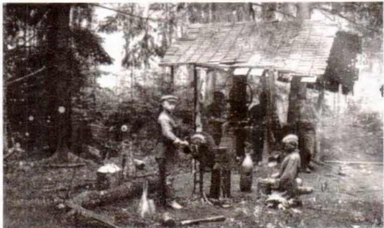
Зброевая майстэрня партызанскай брыгады імя Чкалава.