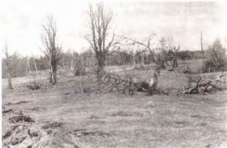
На гэтым месцы была в. Крушнік.

загубілі 2 яе жыхароў, вёску (14 двароў) спалілі.