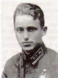
В.Э.Шомадзі ў 1941 г.

атрад з чатырох рот (без артылерыі), які па ўказанні камандуючага 4-й арміяй заняў абарону на рубяжы вёсак Амговічы, Каліта і ўвайшоў у падпарадкаванне 14-га механізаванага корпуса.