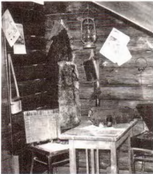
Партызанская друкарня. Куток экспазіцыі Случкага краязнаўчага музея.

Для выданняў партызанскіх друкарняў выкарыстоўвалася любая папера. На звычайным лістку вучнёўскага сшытка надрукаваны быў зварот «Да моладзі Грэскага раёна», а на вокладцы сшытка — лістоўка «Моладзь Случчыны». Пускаліся ў ход абгортачная папера, шпалеры, розныя бланкі і г.д.