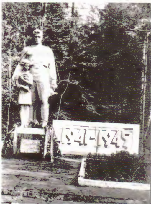
Помнік каля в. Кучына на брацкай магіле воінаў 14-га механізаванага корпуса, якія загінулі ў чэрвені 1941 г.

нашых войскаў і наносіць ім удары ў флангі і з тылу. У выніку гэтага часці і злучэнні Чырвонай арміі ў шэрагу выпадкаў вымушаны былі змагацца ў акружэнні ці адыходзіць на ўсход.