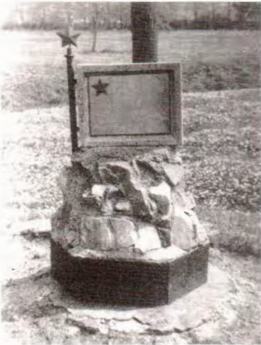
Помнік каля в. Ленькі на месцы бою групы партызан (са жніўня 1943 г. — атрад імя М.А.Астроўскага), якія 10.6.1943 г. знішчылі нямецкі дот, яго варту, захапілі зброю і боепрыпасы.