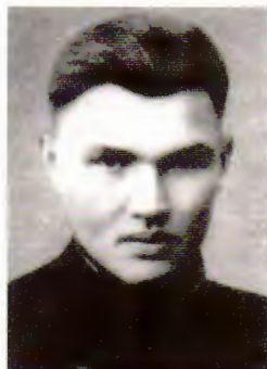
Р. В. Родчанка.